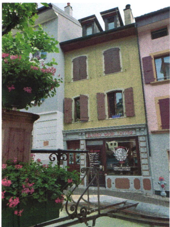
BF 356 : Rue Davall 1

Immeubles de rendement érigés sur 3 parcelles distinctes