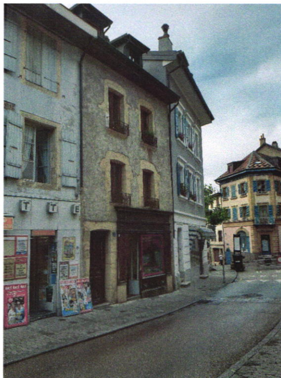
BF 354 : Rue Centrale 29